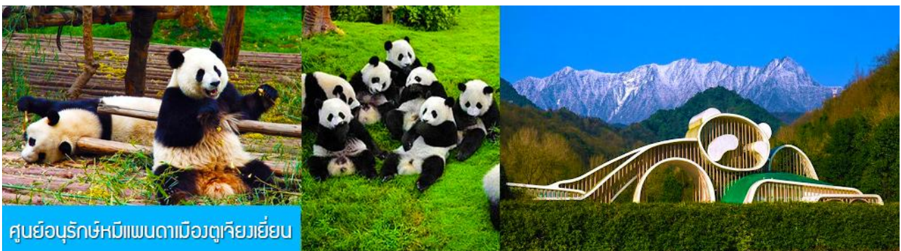
ศูนย์อนุรักษ์หมีแพนดาเมืองตูเจียงเยียน