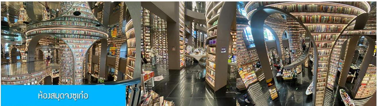
ห้องสมุดจงชู่เก๋อ

พักที่ โรงแรม MINGZHISHANGCHUN HOTEL ระดับ 4 ดาวท้องถิ่นหรือเทียบเท่าในเมืองตูเจียงเยียน