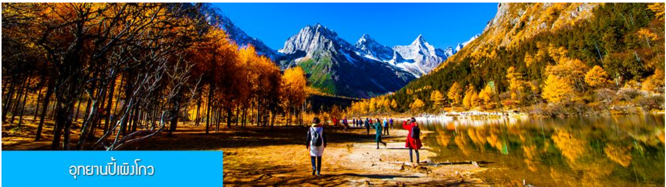
อุทยานปี้เฉิงโกว