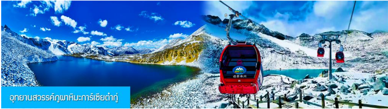
อุทยานสวรรค์ภูผาหิมะการ์เซียต้ากู่