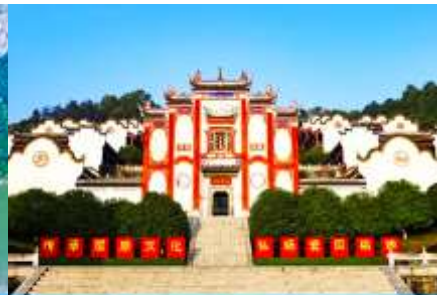
บ้านเกิดกวี ขวี่หยวน