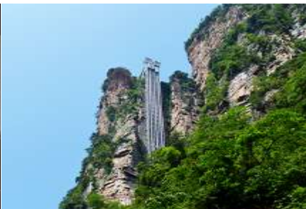
ลิฟท์แก้วไปหลว