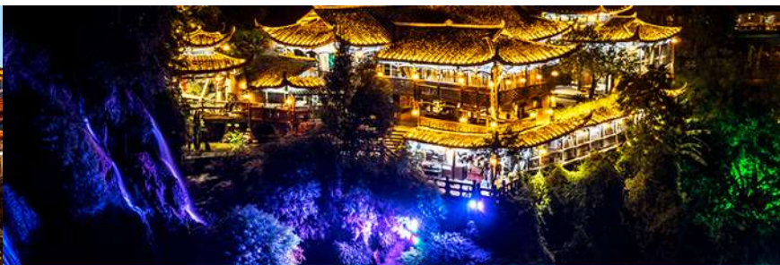
เมืองโบราณฟูหรงเจิ้น