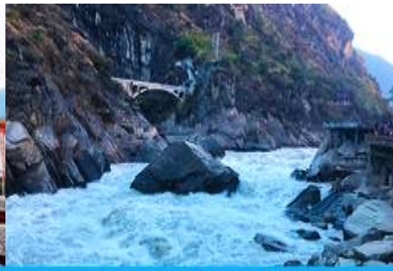
ช่องแคบเลือกระโจน