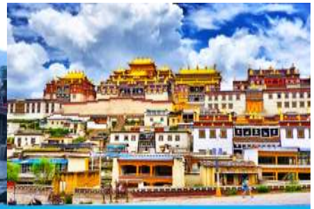
เมืองเซงการีล่า

วันที่สอง เมืองคุนหมิง-นั่งรถไฟความเร็วสูงสู่เมืองต้าหลี่-ช่องแคบเลือกระโจน-จางเตี้ยน-เมืองโบราณเซงการีล่า