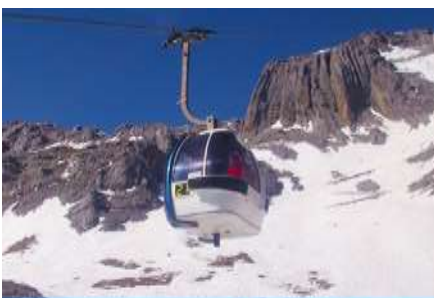
ภูเขาหิมะมังกรหยก (นั่งกระเช้าใหญ่)

ที่พัก FENG HUANG HOTEL ระดับ 4 ดาว หรือเทียบเท่าเมืองลี่เจียง