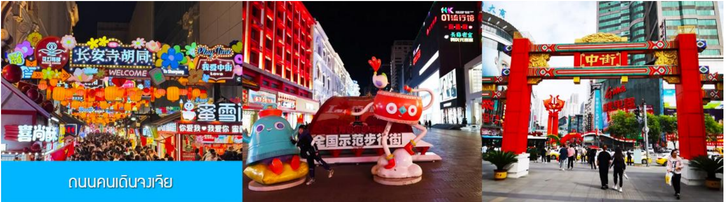
ถนนคนเดินจางเจีย