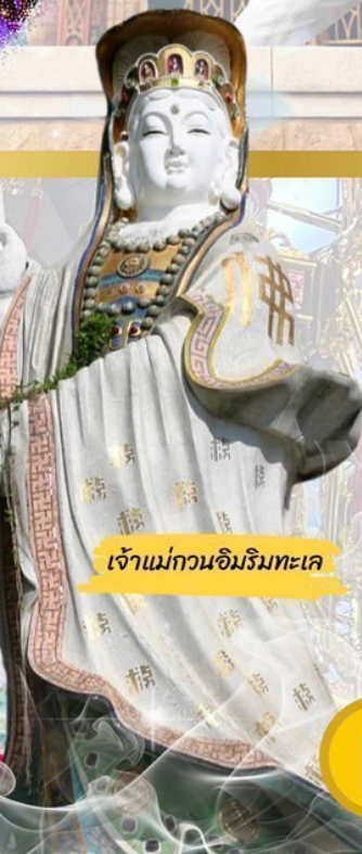
เจ้าแม่กวนอิมวิมทะเล