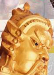
วัดแทงองค์ปัจจุบัน