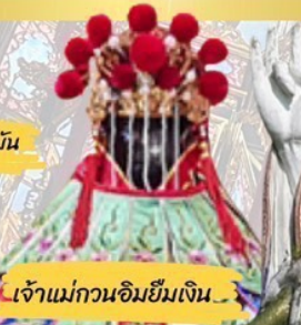
เจ้าแม่กวนอิมยืมเงิน