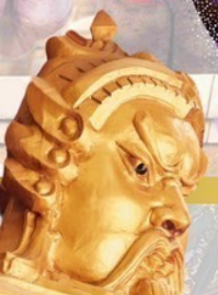
วัดแห่งองค์ปัจจุบัน