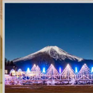
"YAMANAKAKO ILLUMINATION FANTASEUM"