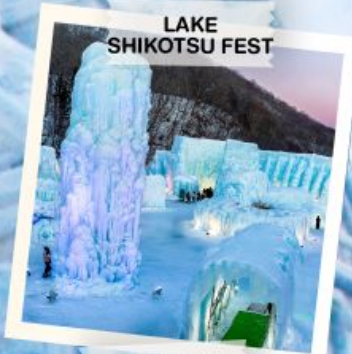
LAKE SHIKOTSU FEST

TOMAMU / FURANO / BIEI / ASAHIKAWA / SOUNKYO / OTARU / SAPPORO