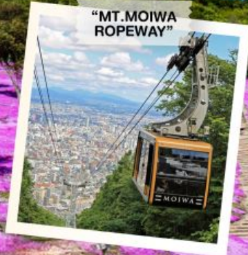
"MT. MOIWA ROPEWAY"

OBIHIRO / FURANO / BIEI / SOUNKYO / KITAMI / MOMBETSU / TAKINOUE / KAMIKAWA / SAPPORO / OTARU / PINKMOSS