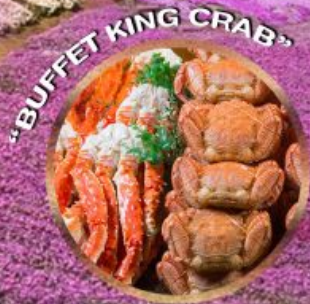
"BUFFET KING CRAB"