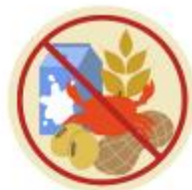
แพ้อาหาร / อื่นๆโปรดระบุ