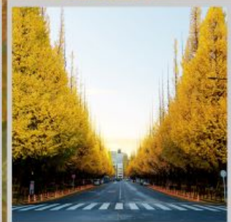
“ICHONAMIKI GINGO AVENUE”