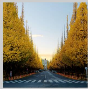
“ICHONAMIKI GINGO AVENUE”