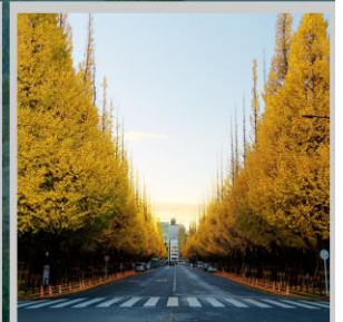
“ICHONAMIKI GINGO AVENUE”