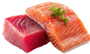
● เนื้อปลาดิบ