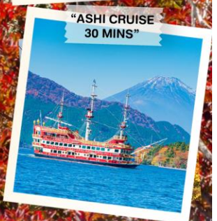
“ASHI CRUISE 30 MINS”