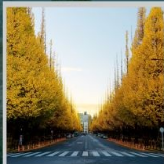
“ICHONAMIKI GINGO AVENUE”