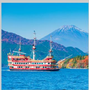
“ASHI CRUISE 30 MINS”