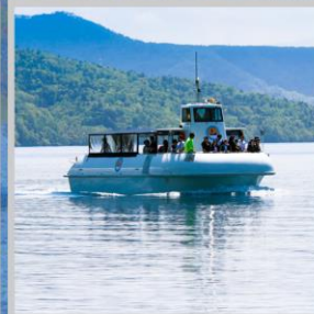
“LAKE SHIKOTSU GLASS BOAT”