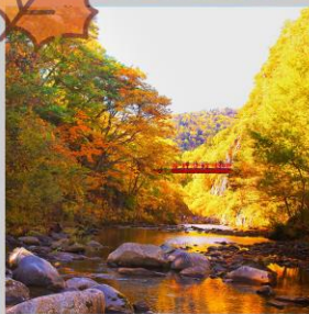
“JOZANKEI FUTAMI BRIDGE”