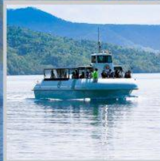
"LAKE SHIKOTSU GLASS BOAT"