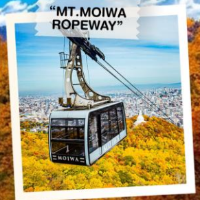
“MT. MOIWA ROPEWAY”