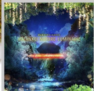
“JOZANKEI NATURE LUMINARIE”