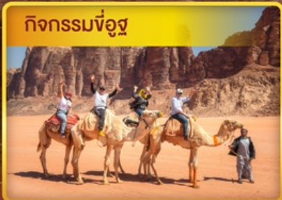
กิจกรรมขี่อูฐ