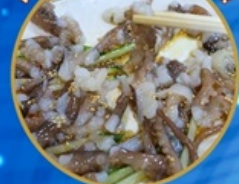
ซันนิกจิ อาหารท้องถิ่น