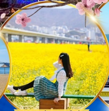
เทศกาลทุ่งดอกคาโนล่า