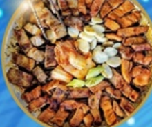
อาหารพรีเมียม ไม่จรงานทัวร์