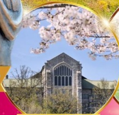
มหาวิทยาลัยสตรีอีฮวา