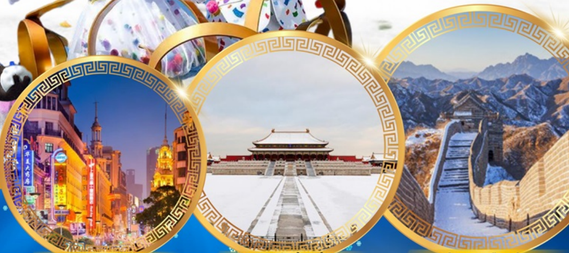
ถนนคนเดินหนานจิง