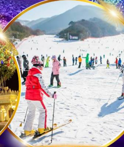
สกีรีสอร์ท

ชมจอ LED ขนาดยักษ์ที่รีสอร์ท 5 ดาว ใหญ่ที่สุดในเอเชียเหนือ