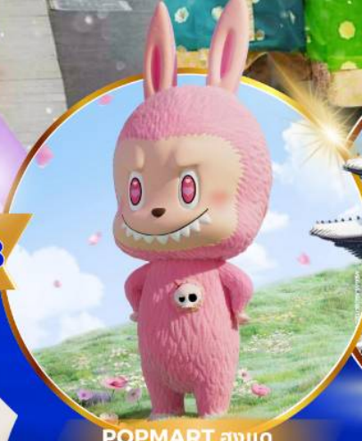
POP MART ฮงแด