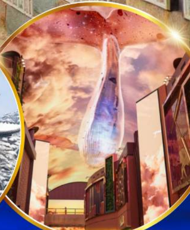
INSPIRE Entertainment Resort

ชมจอ LED ขนาดยักษ์ที่รีสอร์ท 5 ดาว ใหญ่ที่สุดในเอเชียเหนือ ชมพระราชวังคยองบกคุง ย้อนอดีตหมู่บ้านบุคซอน อันอก ใส่ชุดฮันบก ทำข้าวห่อสาหร่าย อิสระช้อปปิ้ง Lotte Duty Free