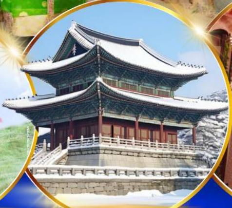
พระราชวังเคียงบกคุง