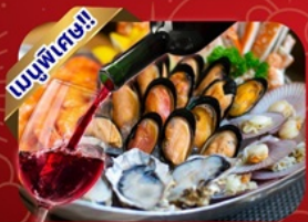
ซีฟู้ดไฮน์แดง