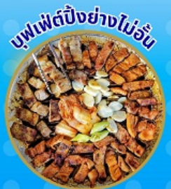
บุฟเฟ่ต์ปังอย่างไม่อื่น