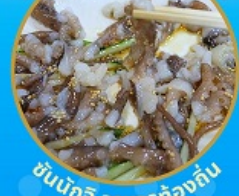
ชั้นนักชี อาหารท้องถิ่น