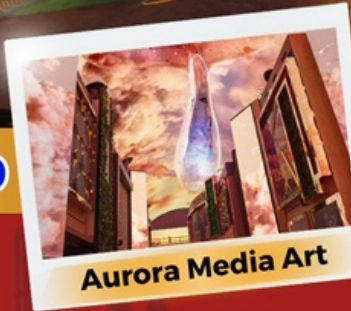
Aurora Media Art