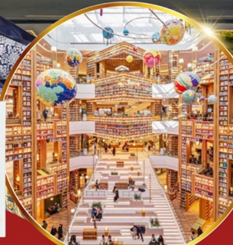
ห้องสมุด สตาร์ฟิลด์ ซูวอน

เชคอินห้องสมุดสุดอลังการ ชมศิลปะดิจิทัลสุดล้ำ บนจอ LED เสมือนจริงขนาดยักษ์ หมู่บ้านเกาหลีโบราณทุกซอก อันอก อิสระซ็อบบี้ง 2 ย่านดัง ซองซู เมียงดง ซ็อบบี้งปลอดภาษี Lotte Duty Free