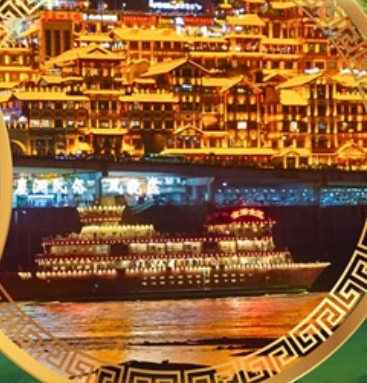
ล่องเรือแม่น้ำแยงซีเกียง

อุทยานแห่งชาติหลุมฟ้าสะพานสวรรค์ ระเบียงกระจก อุทยานเขานางฟ้า ใต้เจียเซียง ห้างการ์เด็นควางหวน พระพุทธรูปแกะสลักหิน หมู่บ้านโบราณฉือชี่ไช่ ชมรถไฟฟ้าทะลุตึก ตึกหุยชิ่ง ตึกตะเกียบ ถนนคนเดินเจียฟ้างเป่ย์ ล่องเรือแม่น้ำแยงซีเกียงวิวคำคิน อิสระช้อปปิ้งหงหยาดัง