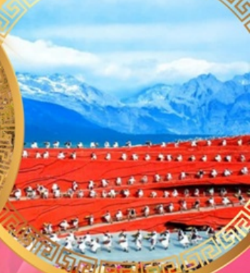
ความประทับใจแห่งลี่เจียง