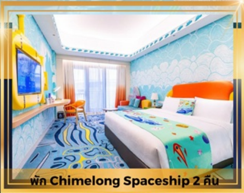
พัก Chimelong Spaceship 2 คืน

ช้อปปิ้งเดอะเวเนเชียน The Parisian The Londoner