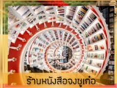
ร้านหนึ่งสี่องซูเก๋