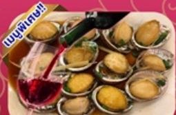
ซีฟู้ด เป้าอ้อ+ไวน์แดง