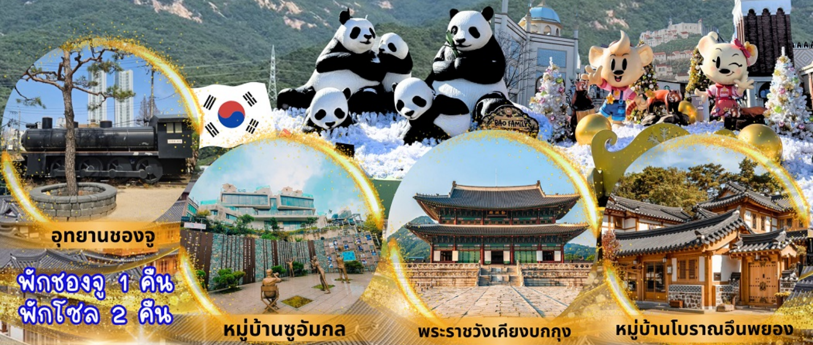
อุทยานซองจู