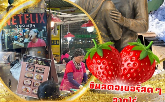
มีผลต่อเบอร์จัดจกจก