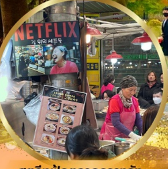
สตรีทฟู้ดตลาดกวางจง

สนุกสุดเหวี่ยงกับกิจกรรมขับริล LUGE !! พิเศษ !! นั่งกระเช้าชมวิว 360° เมืองคังฮวา