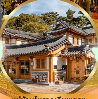
หมู่บ้านโบราณอินพยอง