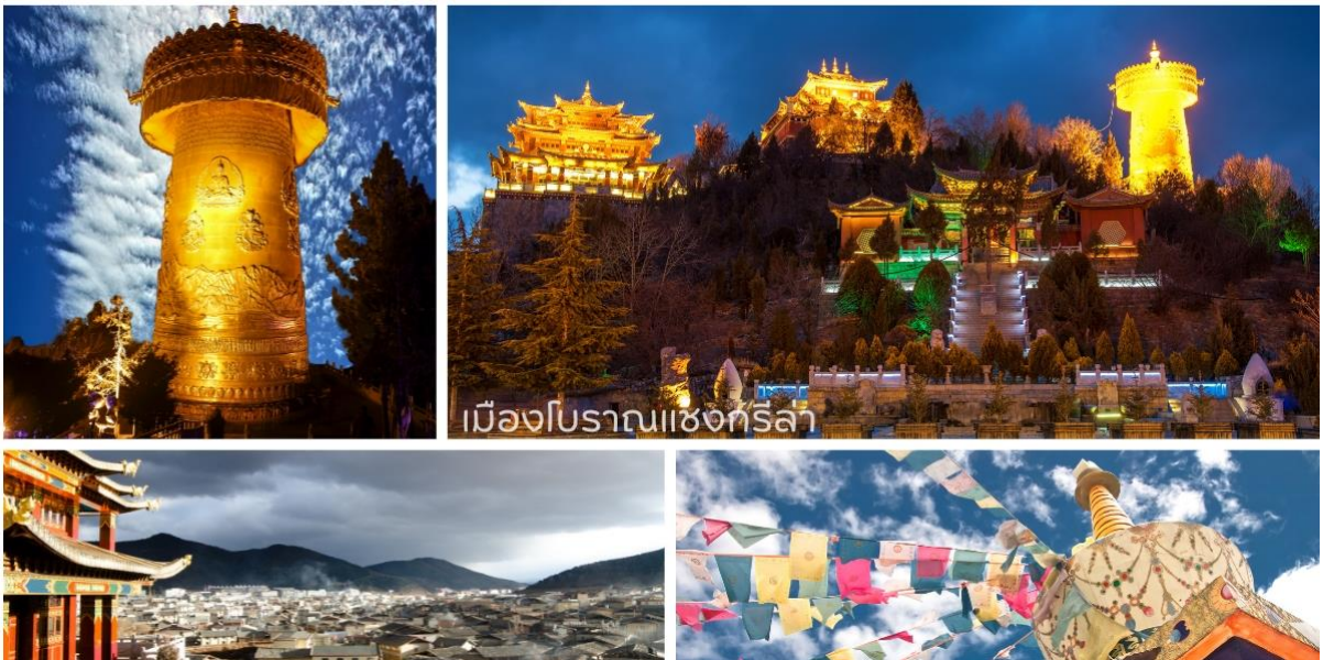
เมืองโบราณแซงกรีล่า

จากนั้นนำท่านชม เมืองโบราณแซงกรีล่า เป็นศูนย์รวมของวัฒนธรรมชาวทิเบตลักษณะคล้ายชุมชนเมืองโบราณทิเบตซึ่งเต็มไปด้วยร้านค้าของคนพื้นเมือง และร้านขายสินค้าที่ระลึกมากมาย