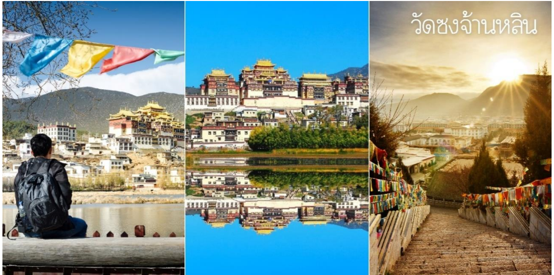
วัดซงจ้านหลิน

จากนั้นนำท่านชม เมืองโบราณแซงกรีล่า เป็นศูนย์รวมของวัฒนธรรมชาวทิเบตลักษณะคล้ายชุมชนเมืองโบราณทิเบตซึ่งเต็มไปด้วยร้านค้าของคนพื้นเมือง และร้านขายสินค้าที่ระลึกมากมาย