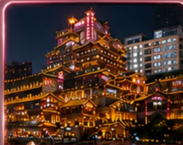
ชมแสงสีหงหยางตั้ง