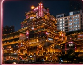
ชมแสงสีหยาต้ง