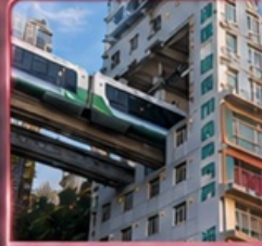
นั่งรถไฟทะลุศึก 2 สถานี