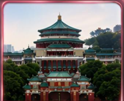
ศาลาประชาคม (ชมด้านนอก)