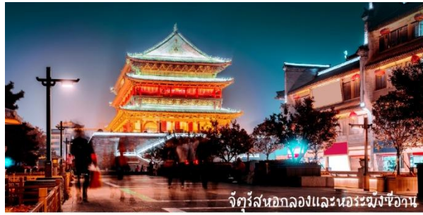
จัตุรัสนอกกำแพงและอนุสาวรีย์ซีอาน