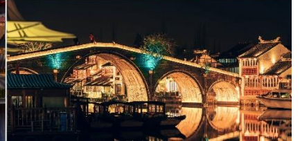
สะพานกงเฉิน (Gongchen Bridge)

นำท่านสู่ ชมวิวคลองจิงฮันดา และสะพานกงเฉิน (Gongchen Bridge) ซึ่งเป็นหนึ่งในสถานที่ที่ดีที่สุดในการชมทางน้ำที่มีชื่อเสียงระดับโลกอย่างแน่นอน มักได้รับการยกย่องว่าเป็นทางน้ำที่เก่าแก่และยาวที่สุดในโลก โดยเริ่มต้นจากปากกึ่งทางตอนเหนือและสิ้นสุดที่ทางโจวทางตอนใต้ ไปเยี่ยมชมอาคารเก่าแก่ ริมคลองและล่องเรือในคลองเพื่อชมและสัมผัสวัฒนธรรมจีนและชีวิตที่แท้จริง (ราคาทัวร์ไม่ค่าสองเรือ)