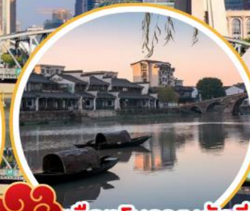
เมืองโบราณถงฉี