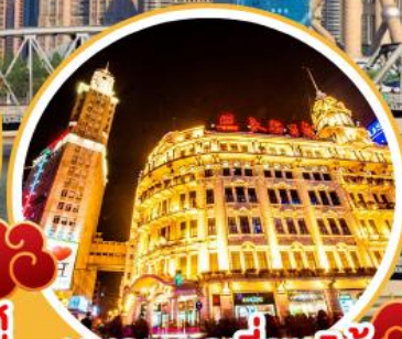
มหานครเซี่ยงไฮ้