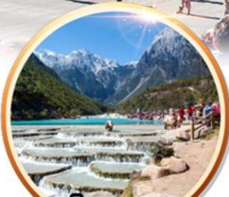
ยอดอมความงาม หุบเขาพระจันทร์สีน้ำเงิน