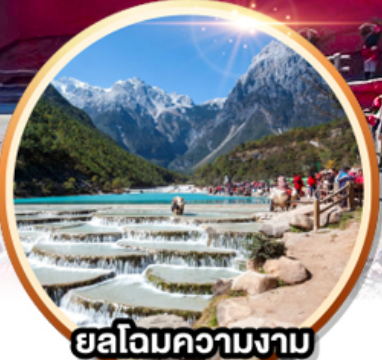
ยลโฉมความงาม คูเขาพระจันทร์สีน้ำเงิน

เดินทาง 23-28 มิ.ย. 67 08-13 / 15-20 ก.ย. 67 6 วัน 5 คืน