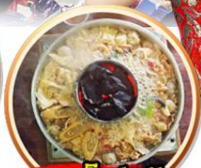
เมนูพิเศษ!! สุกี้เห็ดโตดำ+ปลาเซลมอน