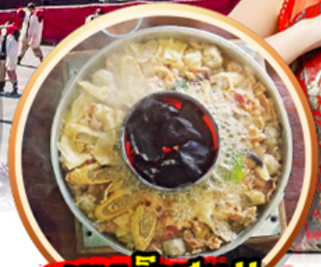
เมนูพิเศษ!! สุกี้หัดโต้ดำ+ปลาซมมอน