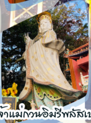
เจ้าแม่กวนอิมรัพลัสเบง