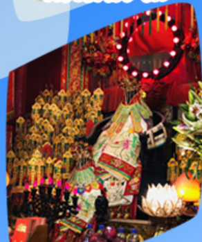
เจ้าแม่กวนอิมซี่มเงิน