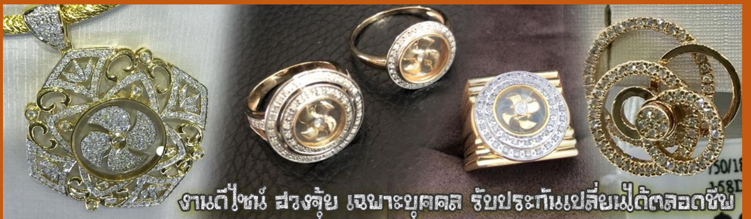
งานดีไซน์ ฮวงจุ้ย เฉพาะบุคคล รับประกันเปลี่ยนเมื่อได้ตลอดชีพ

นำท่านเยี่ยมชม โรงงานจิวเวลรี่ ที่ขึ้นชื่อของฮ่องกงพบกับงานดีไซน์ที่ได้รับรางวัลอันดับยอดเยี่ยม และใช้ในการเสริมดวงเรื่อง ฮวงจุ้ยนำความโชคดี มั่งมั่งแก่ผู้สวมใส่ ซึ่งในเมืองไทยก็ได้นิยมแพร่หลายออกไป ไม่กว่าจะเป็นกลุ่ม ดารา นักการเมือง พ่อค้าแม่ขายที่ประกอบธุรกิจ เจ้าของกิจการห้างร้านต่างๆ ซึ่งเชื่อกันว่าจะนำสิ่งดี ๆ บัดเป่าสิ่งชั่วร้ายให้กับบุคคลที่สวมใส่ ซึ่งจะมีมากมายหลายชนิด เช่นจี้กั๊กัน แหวนรุ่งต่าง ๆ นาฬิกาข้อมือ (ซึ่งผู้สวมใส่จะได้รับการดูอายุมือจากซินแซประจำร้าน เพื่อนำวิธีการเสริมดวงในการสวมใส่โดยไม่ติดค่าบริการ)