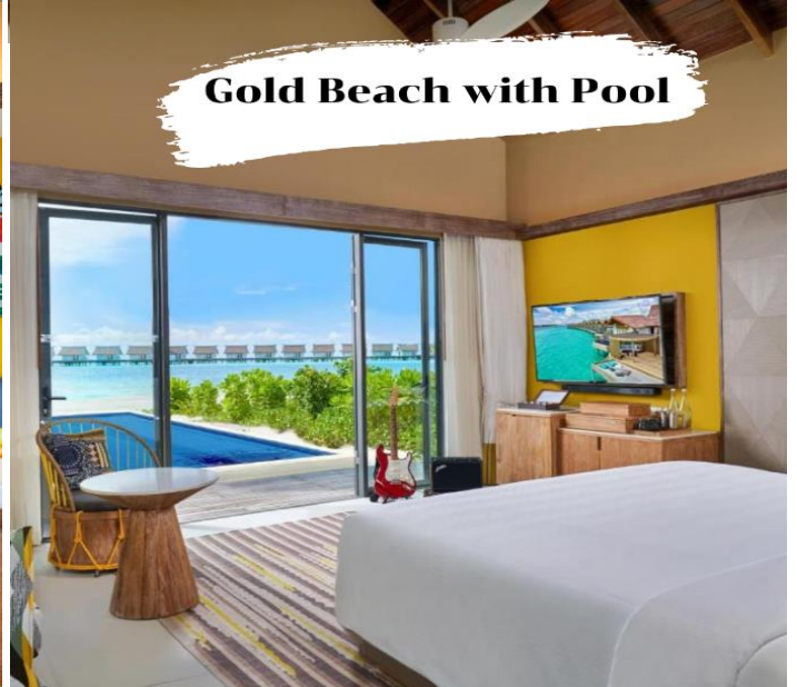
Gold Beach with Pool