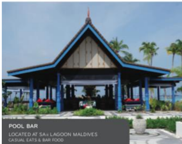
POOL BAR LOCATED AT SAJI LAGOON MALDIVES CASUAL EATS & BAR FOOD