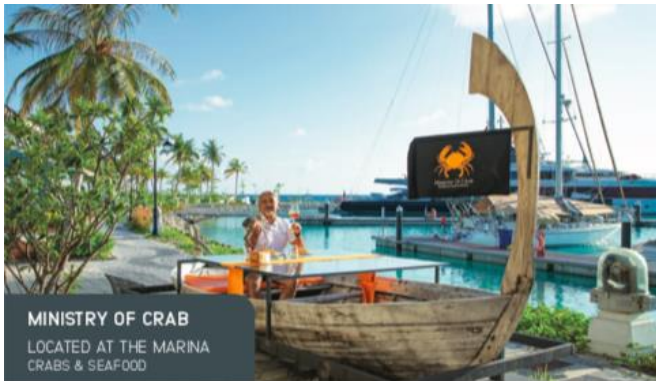
MINISTRY OF CRAB LOCATED AT THE MARINA CRABS & SEAFOOD