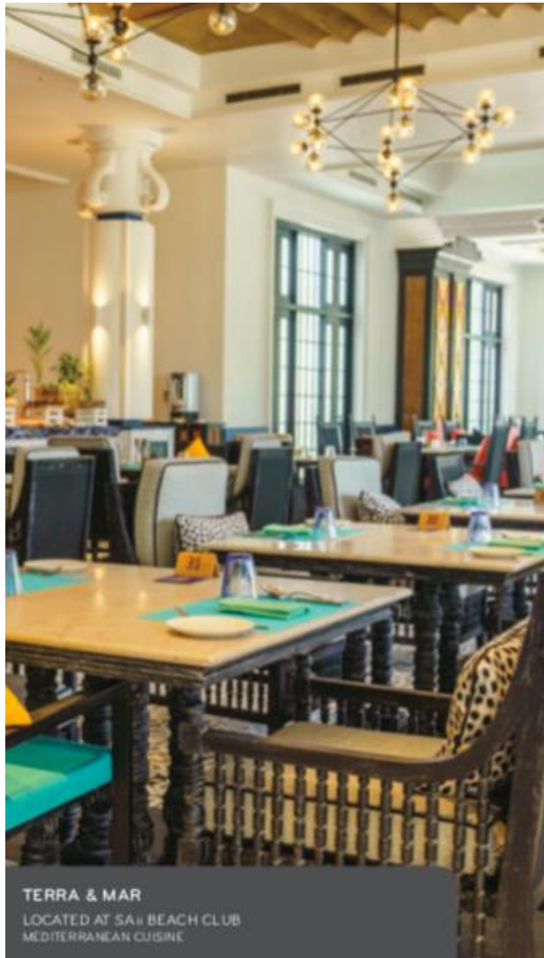
TERRA & MAR LOCATED AT SAJI BEACH CLUB MEDITERRANEAN CUISINE