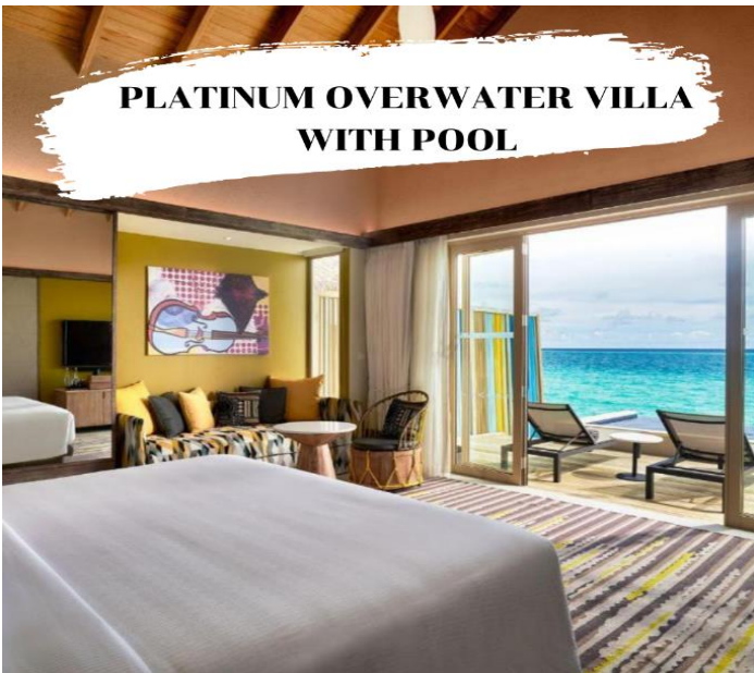
PLATINUM OVERWATER VILLA WITH POOL