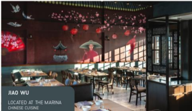
JIAO WU LOCATED AT THE MARINA CHINESE CUISINE