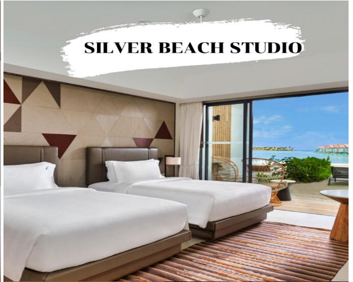
SILVER BEACH STUDIO