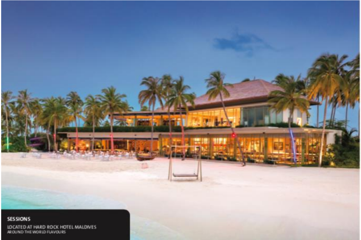
SESSIONS LOCATED AT HARD ROCK HOTEL MALDIVES AROUND THE WORLD FLAVOURS