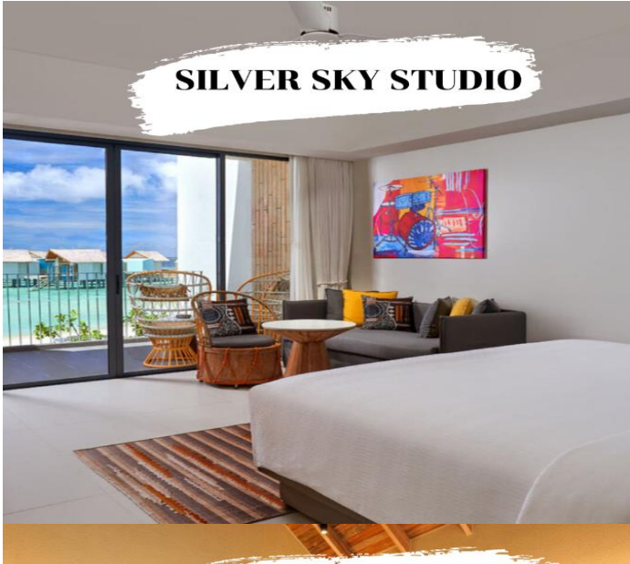
SILVER SKY STUDIO