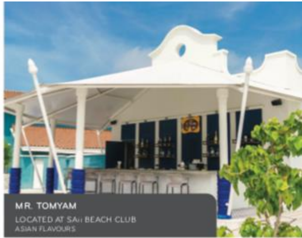
MR. TOMYAM LOCATED AT SAJI BEACH CLUB ASIAN FLAVOURS