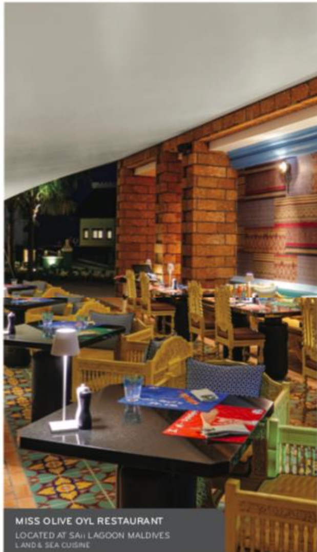
MISS OLIVE OYL RESTAURANT LOCATED AT SAJI LAGOON MALDIVES LAND & SEA CUISINE