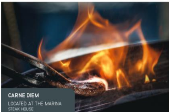
CARNE DIEM LOCATED AT THE MARINA STEAK HOUSE