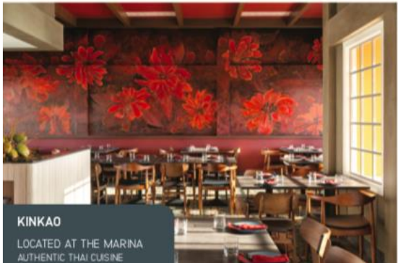
KINKAO LOCATED AT THE MARINA AUTHENTIC THAI CUISINE