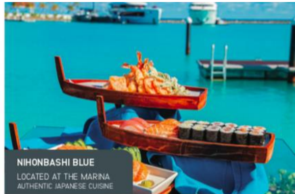
NIHONBASHI BLUE LOCATED AT THE MARINA AUTHENTIC JAPANESE CUISINE