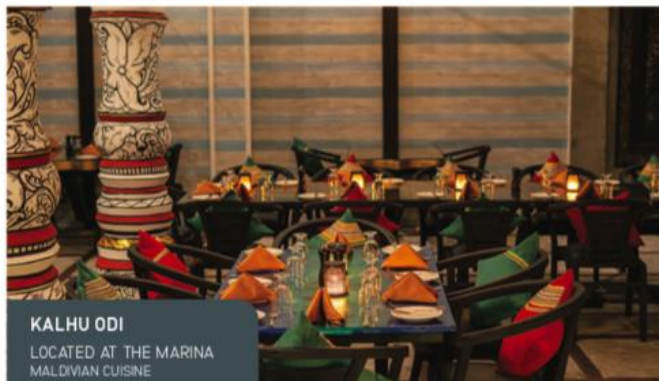
KALHU ODI LOCATED AT THE MARINA MALDIVIAN CUISINE