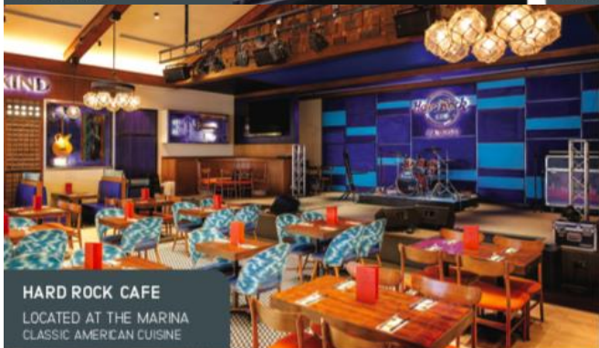
HARD ROCK CAFE LOCATED AT THE MARINA CLASSIC AMERICAN CUISINE