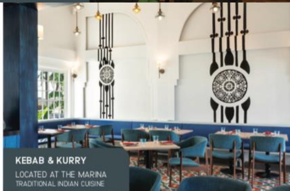
KEBAB & KURRY LOCATED AT THE MARINA TRADITIONAL INDIAN CUISINE