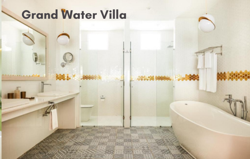
Grand Water Villa with Pool