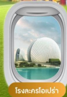
โรงละครโอเปร่า