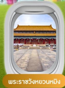
พระราชวังหยวนหมิง