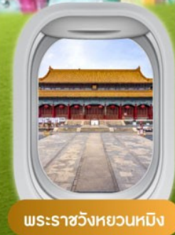
พระราชวังหยวนหมิง