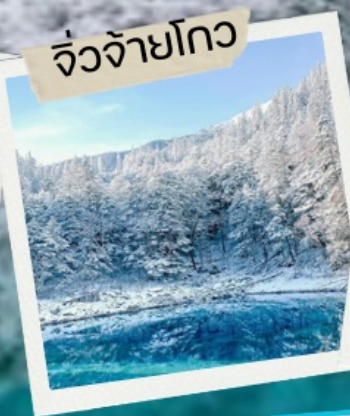
จิวจ้ายโกว