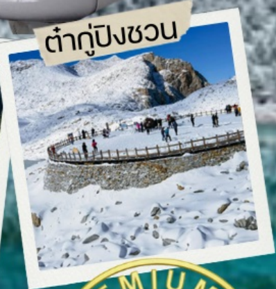
ต่ากู่ปิงชว่น