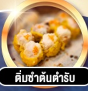
ต้มซ่าตันตำรับ