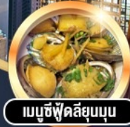
เมมูซีฟู้ดลิขุมบุญ