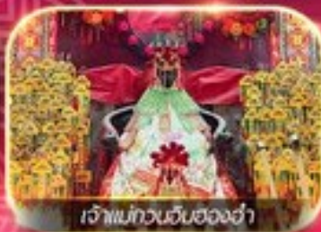
เจ้าแม่ทวนอิมสองฮ่า