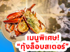
เมนูพิเศษ! "กุ้งล็อบสเตอร์"