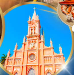
โบสถ์สีชมพู