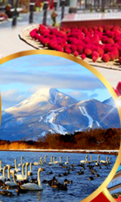
ทะเลสาบอินาวะชิโระ