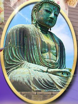
พระใหญ่คามาคูระ