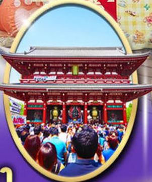
วัตเกาะซากุระ