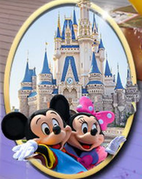
อิสระเลือกซื้อบัตร Tokyo Disneyland