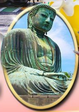
พระใหญ่คามาคุระ