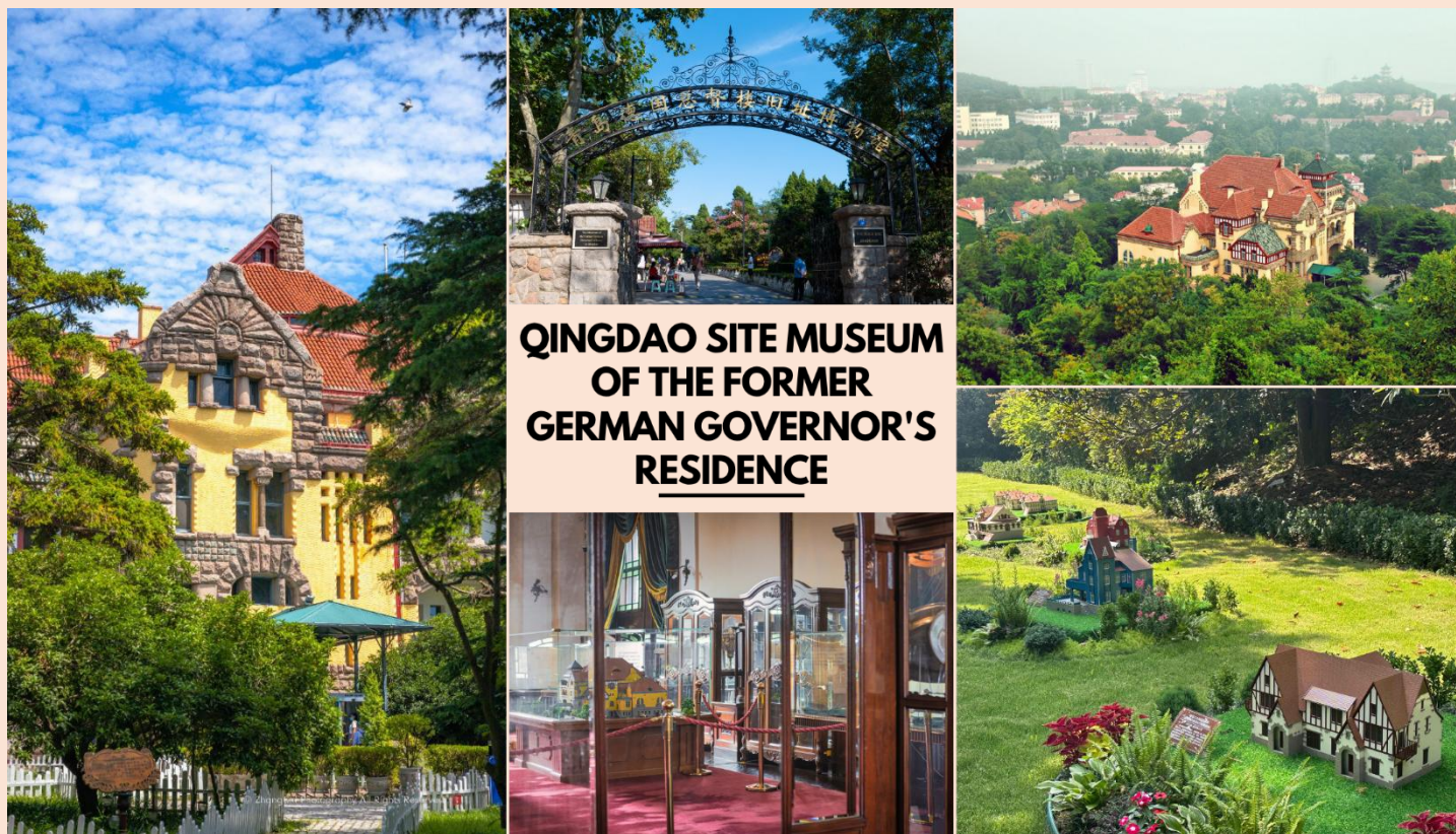
QINGDAO SITE MUSEUM OF THE FORMER GERMAN GOVERNOR'S RESIDENCE